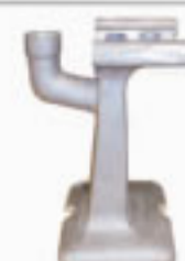
Suporte da Proteção Acrílica Cod. 1487