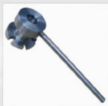
Dispositivo Aperto Rápido Cod. 1700