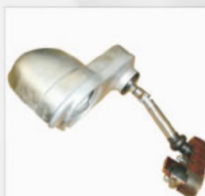
Fresador Completo Cod. 1697