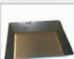
Bandeja para Cavaco Cod. 0055