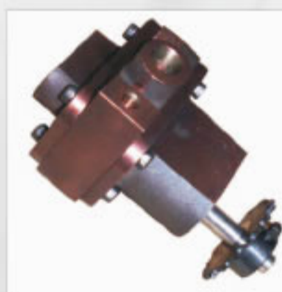
Bomba de Óleo Completa Cod. 803