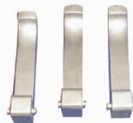
Jogo de Garras para Tornos A42 Cod. 1764 TB42/60 Cod. 1705 TD26/36 Cod. 1706