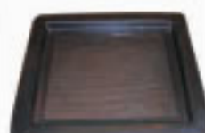
Inserto Peneira Cod. 0065