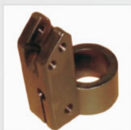
Suporte 45° Cod. 1703